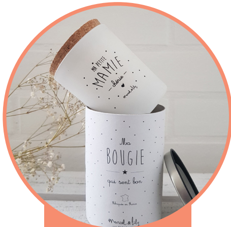
Les bougies de Cécile marceletlily.fr