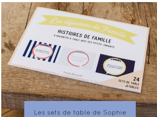
Les sets de table de Sophie www.grand-mercredi.com