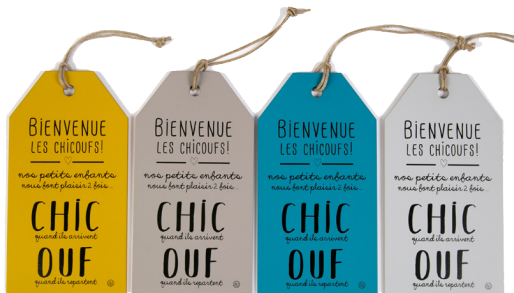
Les étiquettes de Sophie www.sophie-janiere.fr