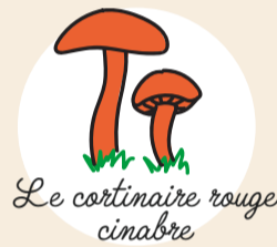
Le cortinaire rouge cinabre

Lieu : n'importe quelle forêt autour de chez vous (les pins et les épicéas seront quand même votre valeur sûre).