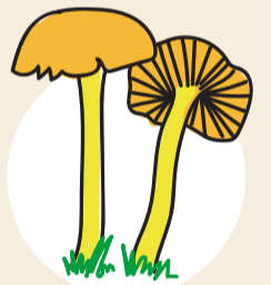
Le cortinaire couleur de rocou