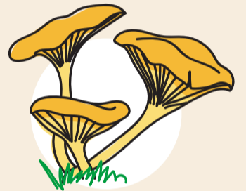
La pleurote de l'olivier